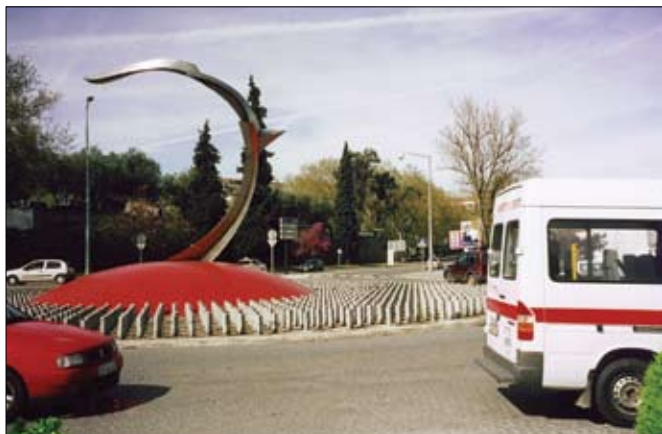
Hringtorg skreytt með listaverki.