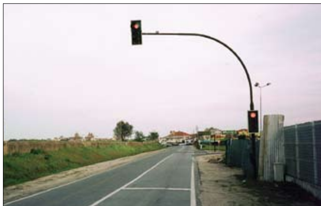
Ökumaður sem ekur hraðar en á 50 km/klst. inn í þéttbýlið þarf að stansa á rauðu ljósi.