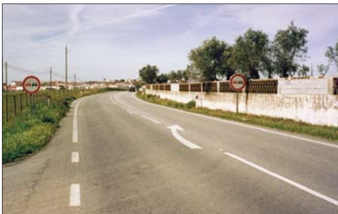
Framúrakstur bannaður bæði með yfirborðsmerkingum og skiltum.