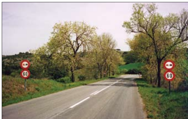
Hámarkshraði lækkaður á hættulegum vegarkafila.