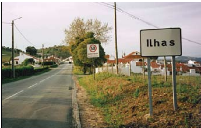
Hámarkshraði í þéttbýli er 50 km/klst.