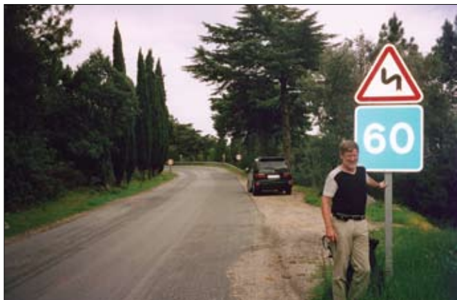
Leiðbeindandi hraði á varasömum vegarkafli.